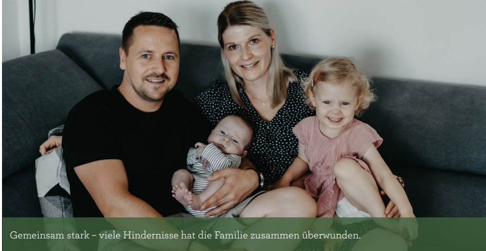
Gemeinsam stark – viele Hindernisse hat die Familie zusammen überwunden.