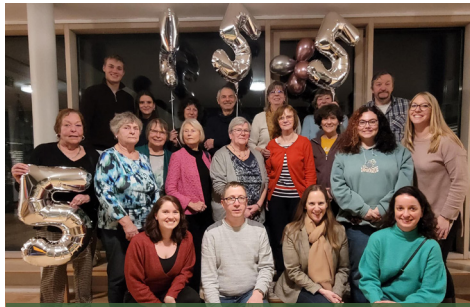
Unser tolles Ehrenamtsteam