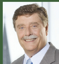
Dr. h. c. Fritz Schramma