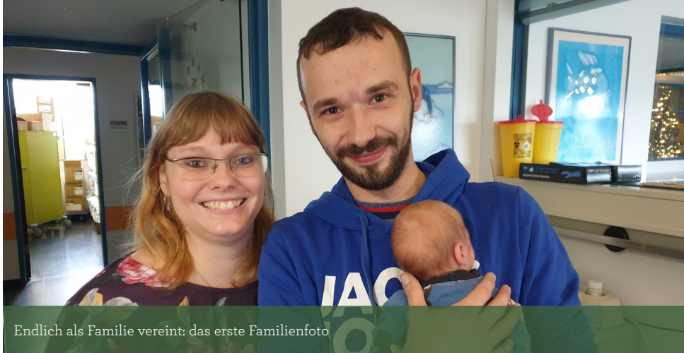
Endlich als Familie vereint: das erste Familienfoto